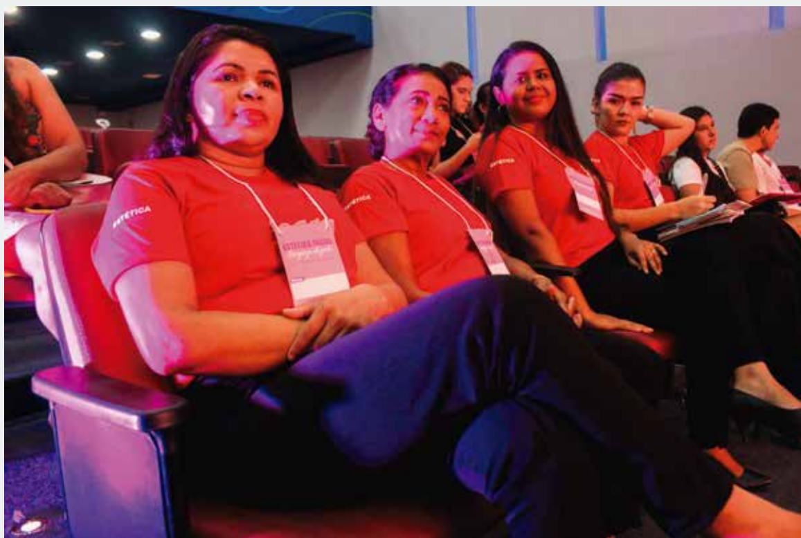
CAMISETAS PERSONALIZADAS PARA ALUNOS